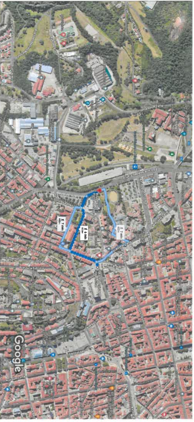
Images ©2024 Airbus, Maxar Technologies, Données cartographiques ©2024 Google 50 m

7 Av. Président Emile Loubet, 42100 Saint-Étienne À pied 400 m, 6 min à Bd Pierre-Mendès-France, 42000 Saint-Étienne